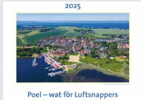
Poel – wat för Luftsnappers

Poel stets vor Augen? Wer das möchte, ist mit dem farbigen Kalender „Poel 2025“ bestens bedient. Für das eigene Wohnzimmer, für die ganze Familie, Freunde und liebe Buten-Poeler: die letzten Exemplare dieses schönen Kalenders sind jetzt noch zu erwerben in der Kirche, in der Kurverwaltung, im Museum, in der Gemeindeverwaltung, im Gast-