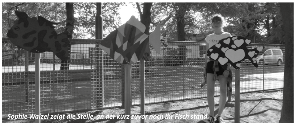
Sophie Walzel zeigt die Stelle, an der kurz zuvor noch ihr Fisch stand.

Vielleicht haben sie schon die schönen bunten Fische auf dem Schulgelände entlang der Strandstraße gesehen. Gerade nur eine Woche ist der Fischschwarm gemeinsam geschwommen, bevor in der Zeit vom 12. bis 15. Mai der Fisch von Sophie Walzel gestohlen wurde.