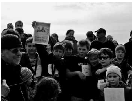
Siegerehrung Platz 3 „Beachboys“