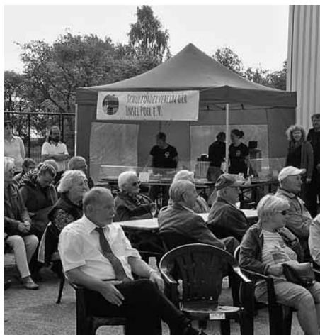
Der Schulförderverein verkaufte Kaffee und Kuchen.

Kulinarisch wurden die Besucher mit Kaffee und Kuchen verwöhnt, der vom Schulverein der Kirchdorfer Schule angeboten wurde, und wer es lieber herzhaft mochte, konnte sich an der Gulaschkanone bedienen. Daniel Gransow