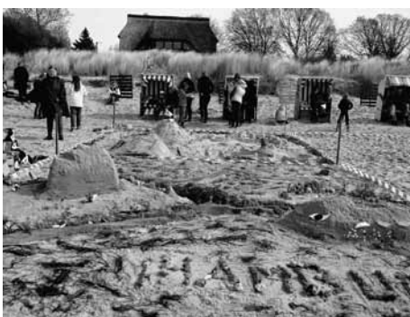
Platz 3 „Beachboys“ (Elbphilharmonie)