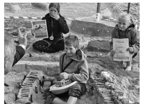
Siegerehrung Platz 1 „Sandwürmer“