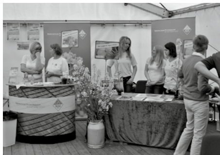
Informationsstand der NPZ Malchow