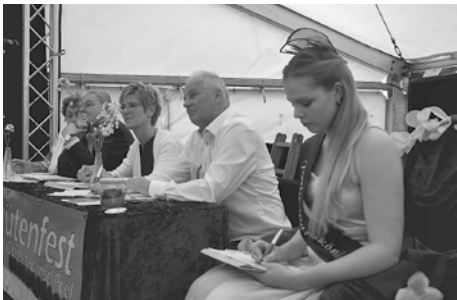
Die Jurymitglieder 2017 (Erläuterungen stehen im Text)