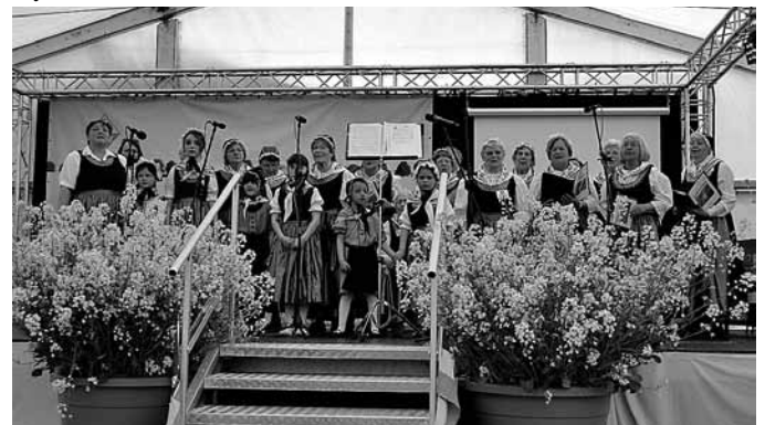
Poeler Trachtenchor und Kindertanzgruppe

Christin Slepnow, Kurverwaltung Insel Poel Fortsetzung siehe Seite 2