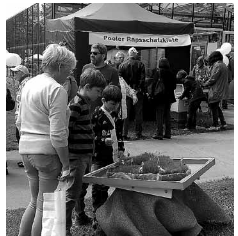
Die Insel aus Gras fand reges Interesse.