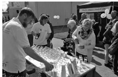
Sektempfang zum Jubiläum