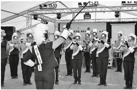
Schwungvoll und musikalisch wurde das Rapsfest durch die Deutsche Jugend-Brassband aus Lübeck eröffnet.