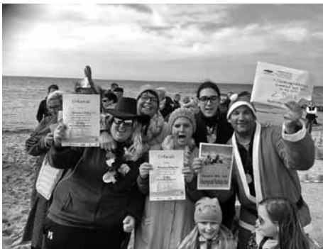
Siegerehrung Platz 2 „Poeler Faschingsclub“