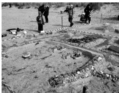
Platz 1 – „Sandwürmer“ (Hafen Timmendorf)

Von der Kurverwaltung wurden die Teilnehmer mit Schaufel & Eimer ausgestattet. Viele der Teams nutzten die Möglichkeit, ihre Sandskulpturen mit mitgebrachten Dekorationsmaterialien zu verschönern und den letzten Pfiff zu verleihen, der hoffentlich zum Sieg führen würde. Während sich die zwei Stunden Bauzeit langsam dem Ende neigte, wurde es nochmal hektisch. An den letzten kleinen Feinheiten wurde gewer-