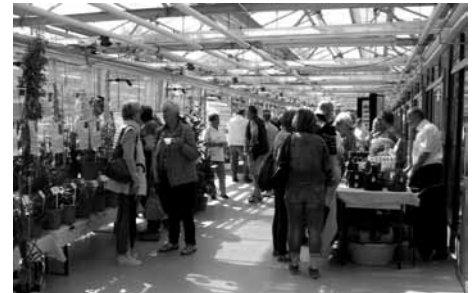
Teeverkostung und Imkerstand im Gewächshaus der IPK Genbank

Am 20. Mai öffnete die Genbank in Malchow Tore und Gewächshäuser für etwa 500 interessierte Besucher aus nah und fern, denn das 25-jährige Jubiläum des Standortes sollte gewürdigt werden.