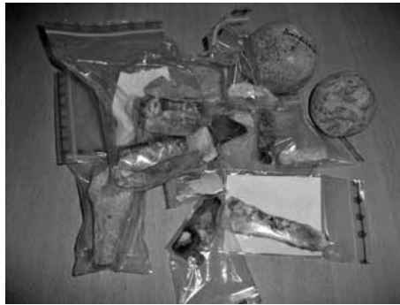
einige ausgewählte Fundsachen