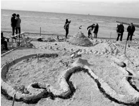
Platz 2 „Poeler Faschingsclub“ (Die Insel Poel)