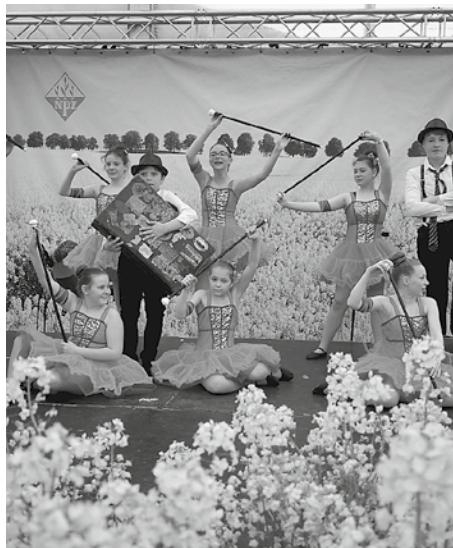
Kindertanzgruppe, Tanzstudio Hagenow